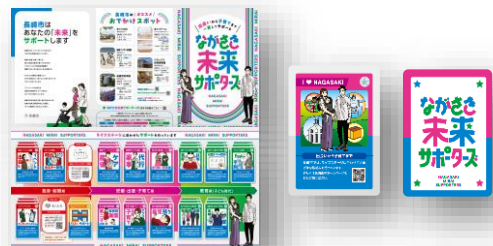
① メインキャッチコピーの制定 ② パンフレット・カードの制作