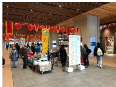
④ 屋内・屋外ビジョンでの放映