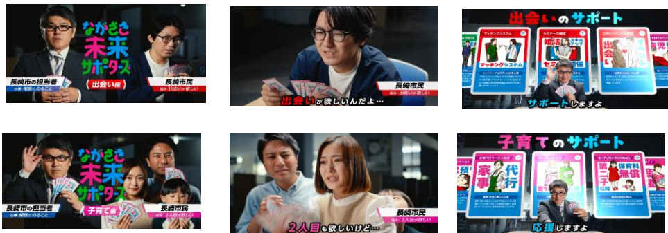
③ カードゲームを題材にした動画の制作 (出会い・子育て)