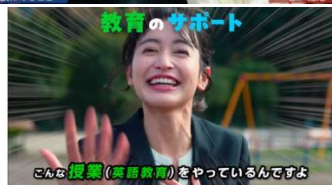
③カードゲームを題材にした動画の制作（出会い・子育て・教育）