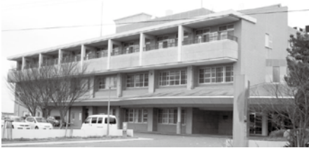
▲施設が併設される野母崎診療所

その結果、高齢者福祉施設整備事業費補助金については、これまでの野母崎診療所の活用に対する地元の懸念が一定解消で