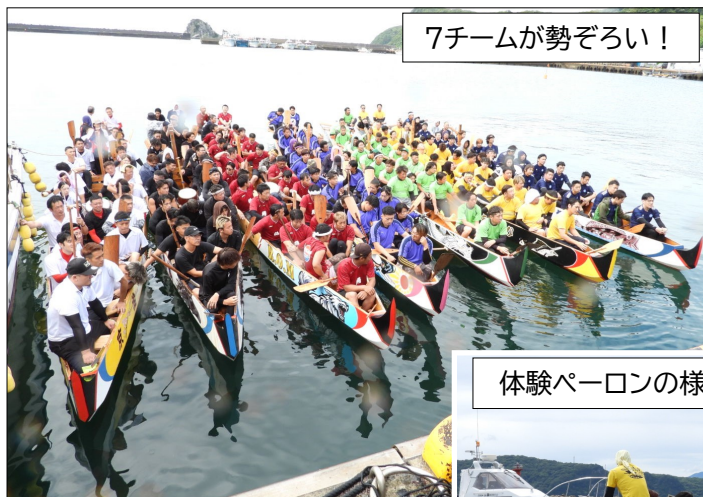
7チームが勢ぞろい!