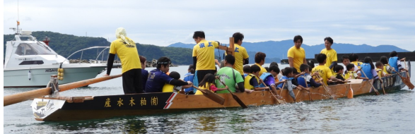
体験ペーロンの様子