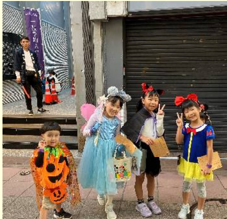
長崎キッズ ハロウィンパーティー