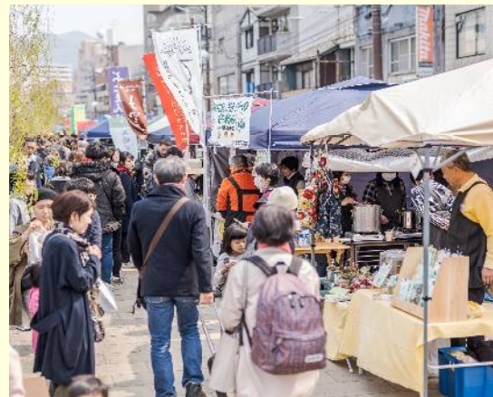
ながさきオーガニックマルシェ