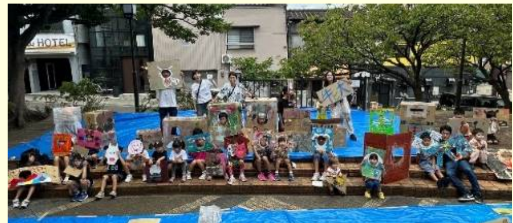
Art Park 構想（公園でお絵描き）