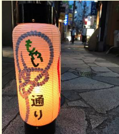
「路地文化に灯りを」 プロジェクト