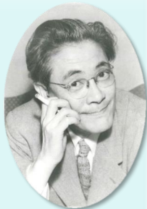
清水崑-Simizu Kon (1912~1974)