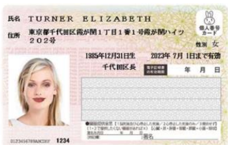
現行個人番号カード