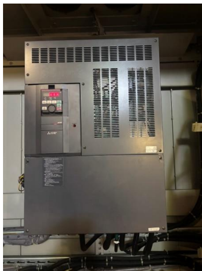
インバータユニット②