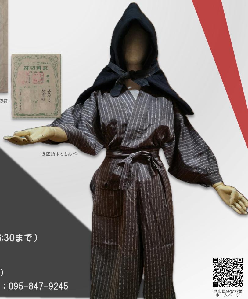
防空頭巾ともんぺ

入館 無料 開館時間 9:00~17:00 (入館は16:30まで) 休館日 月曜日