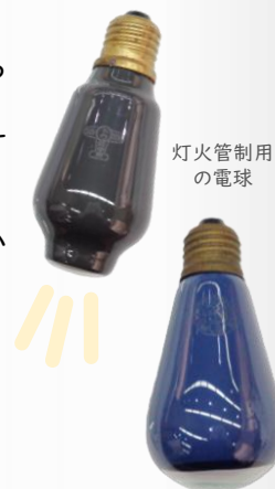
灯火管制用の電球