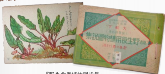
『野生食用植物図説集』