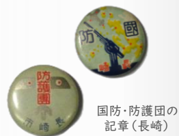
国防・防護団の記章(長崎)