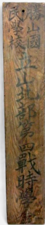
勝山国民学校 戦時校舎の看板

戦時下を生きた人々の暮らしへ思いを馳せるとともに、平和について考えるきっかけとなりましたら幸いです。