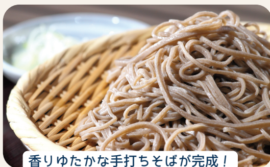
香りゆたかな手打ちそばが完成!