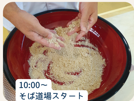
10:00～ そば道場スタート