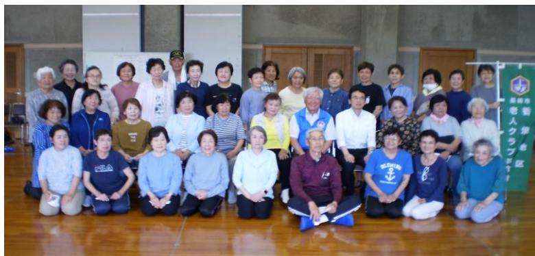
試合前に全員で写真撮影

5月20日（水）香焼公民館で香焼地区老人クラブ連合会による「ペタンク競技大会」が開催されました。8チームで3試合（ランダム対抗）で順位を競い、交流を深めました。