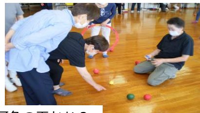
目標玉に近いのは何色の玉かな？