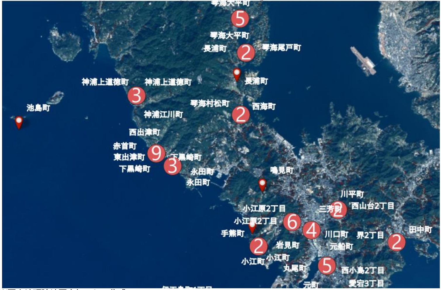
全体分布図（長崎市内北部側） ※ 赤丸内の数値は活用可能性のある財産の地図上の位置と件数