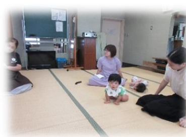
<おはなし会の様子>

夏野菜の準備はできましたか？ 花づくり野菜づくりに適した季節になりました。初心者でも大丈夫！ガーデニング作業の資料がたくさんありますよ！