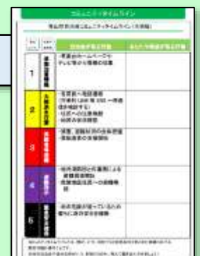
コミュニティタイムライン