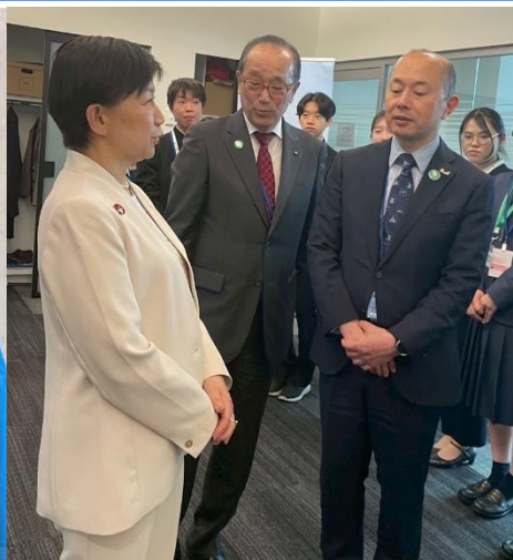
国連事務次長との面会