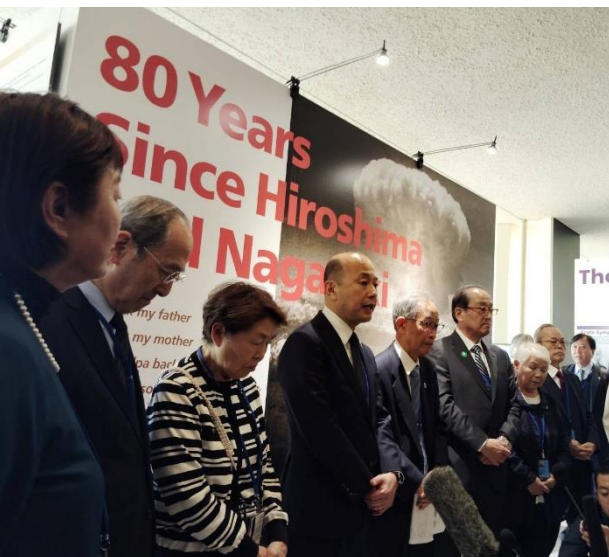
国連原爆展オープニング出席