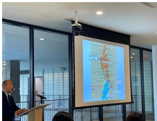
国連国際学校（UNIS） での講演・交流