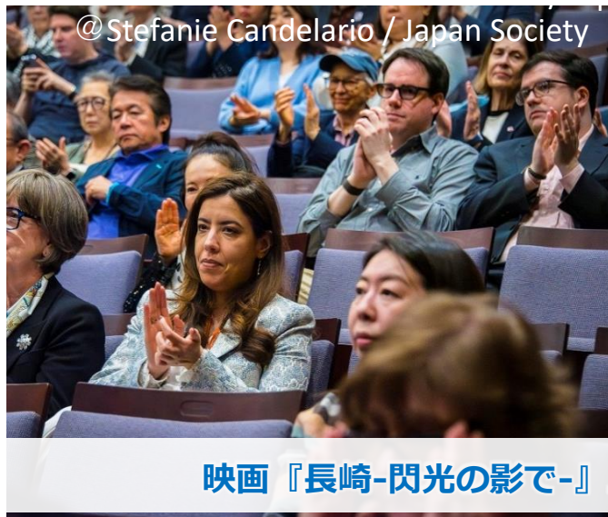
映画『長崎-閃光の影で-』上映会