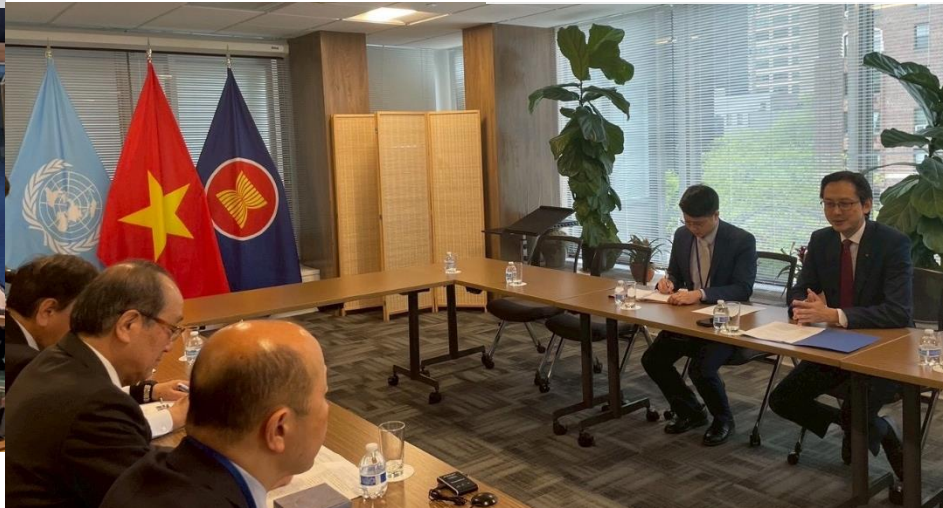
NPT再検討会議議長との面会