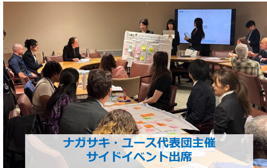
ナガサキ・ユース代表団主催 サイドイベント出席