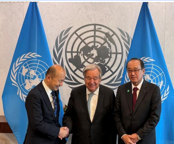
国連事務総長との面会