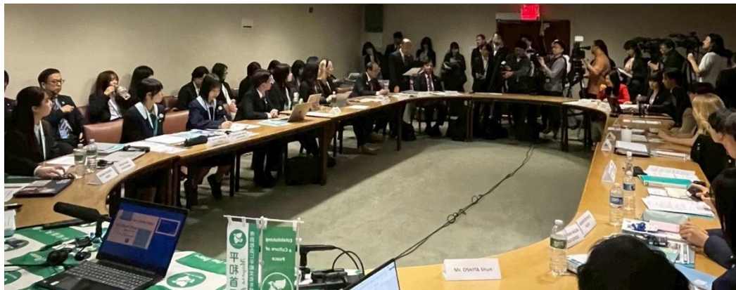
平和首長会議主催サイドイベント （ユースフォーラム）出席