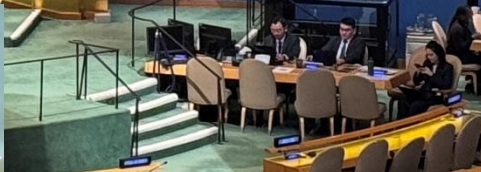
NGOセッションでの 市長演説