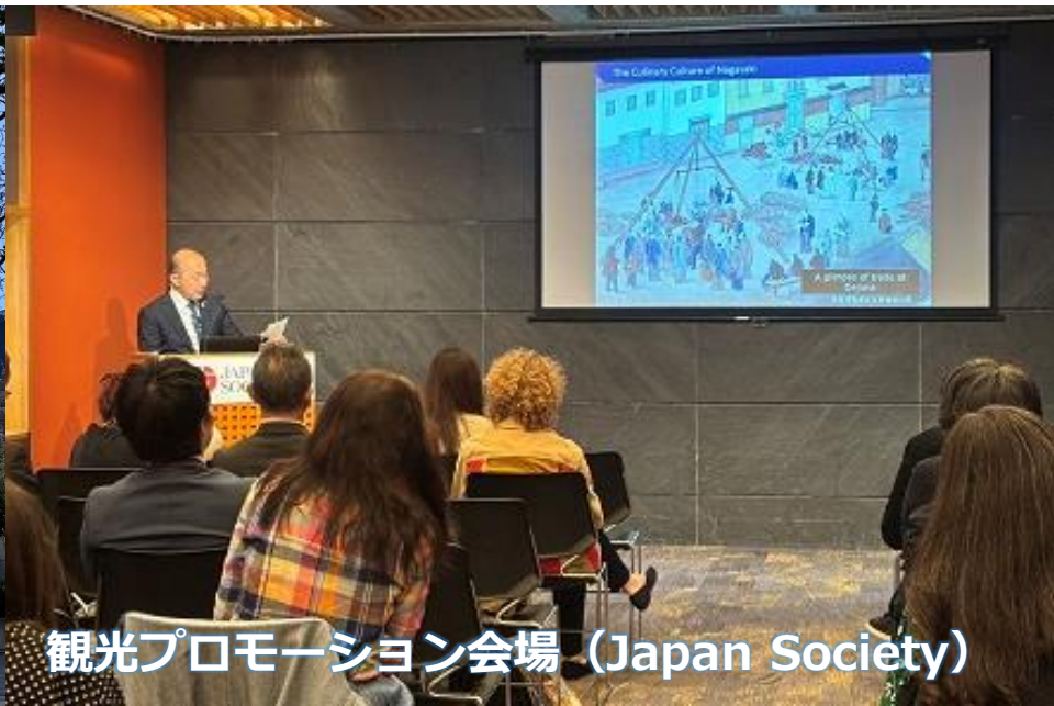
観光プロモーション会場（Japan Society）