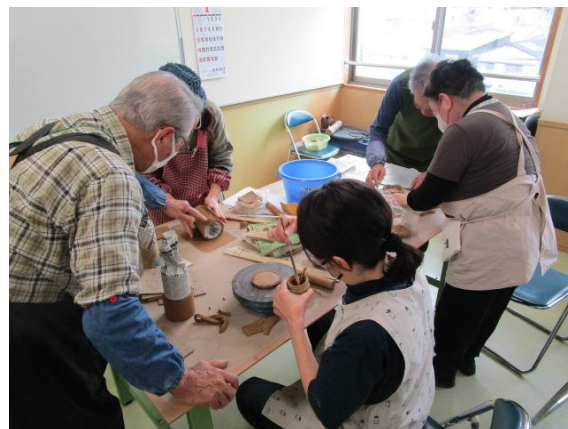
やきもの事始め(4/17～全5回)