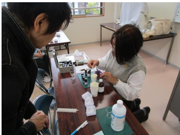
アロマスプレーづくり(4/18)