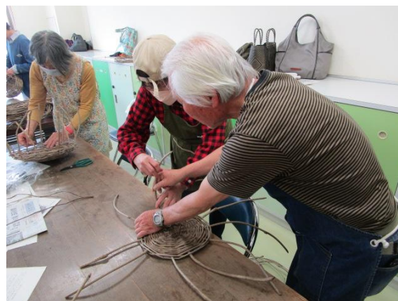
楽しいガーデニング(4/21～全4回)