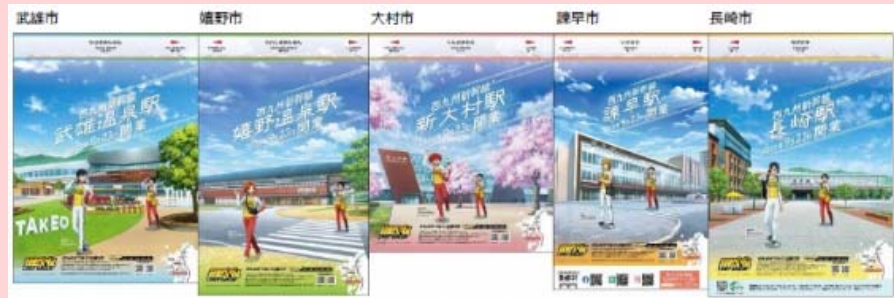
沿線5市の広報誌（2022年7月号）裏面をジャック

開業までの気運醸成を図るため、沿線5市内のあらゆる場所に西九州新幹線の開業をPRするコラボポスターやのぼりを掲示、缶バッジやポケットティッシュは各市の様々な関連イベント等にて配布