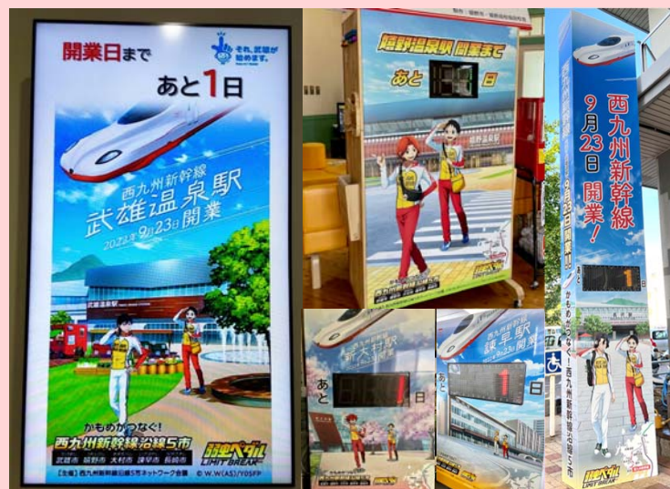
開業100日前からコラボVer.のカウントダウンボードを設置

西九州新幹線沿線5市とTVアニメ「弱虫ペダル LIMIT BREAK」とのコラボレーション事業として、様々な企画を実施しました。各市のPRを担当したキャラクターだけではなく、背景として西九州新幹線の各駅と新幹線かもめの描き下ろしも制作しました。