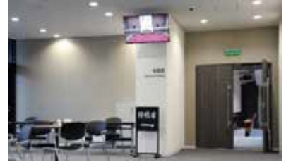
▲市庁舎6階傍聴受付