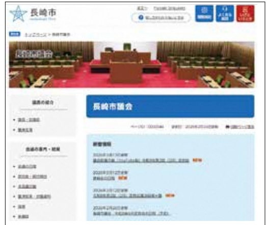
長崎市議会ホームページ