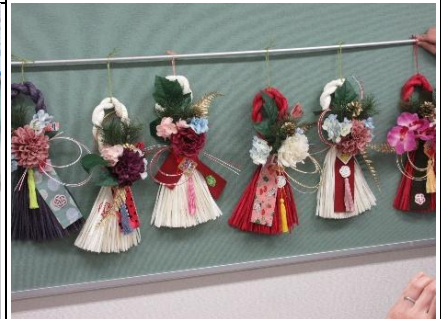
『カジュアルしめ飾りづくり』