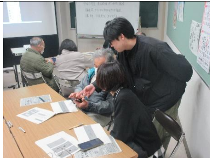
『ラインからスマホ講座』