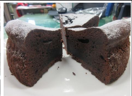
『大人のスイーツづくり』