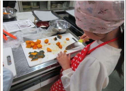
『ハロウィンのお菓子づくり』