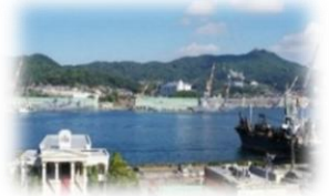
図書室からの風景