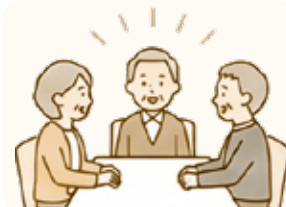
高齢者サロンの開催