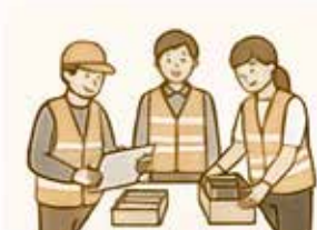
災害時の ボランティアセンター運営