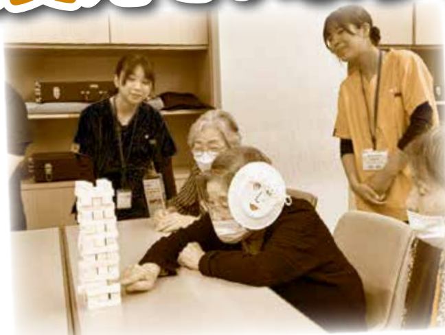
わははくらぶ 笑々々来楽部の活動!