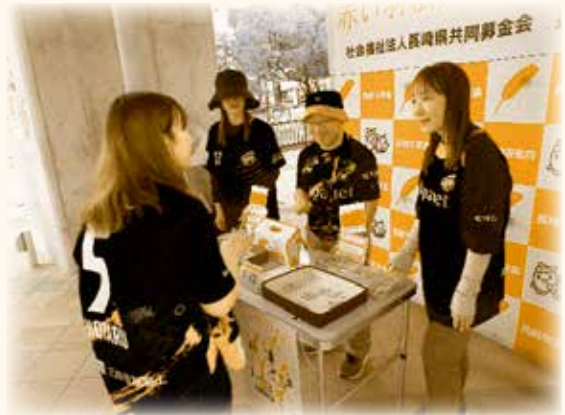
長崎スタジアムシティ高架下での募金活動