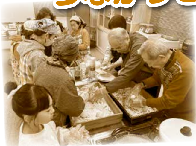
西北もちつき大会!