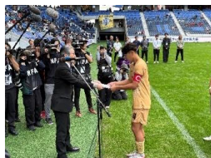
高校生サッカー大会支援 (R7)