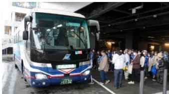
無料シャトルバスの様子