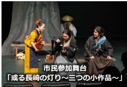
市民参加舞台 「或る長崎の灯り～三つの小作品～」