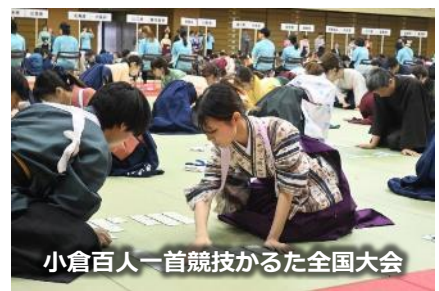
小倉百人一首競技かるた全国大会