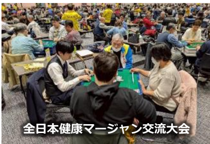
全日本健康マージャン交流大会