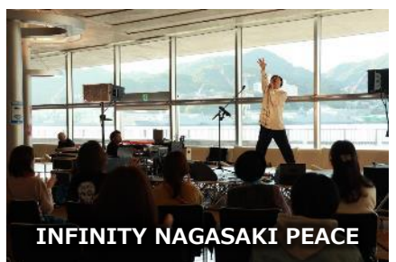
INFINITY NAGASAKI PEACE