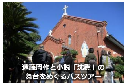
遠藤周作と小説「沈黙」の 舞台をめぐるバスツアー