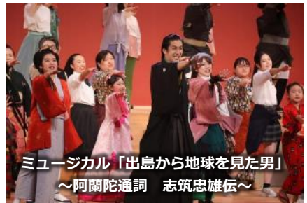
ミュージカル「出島から地球を見た男」 ～阿蘭陀通詞 志筑忠雄伝～