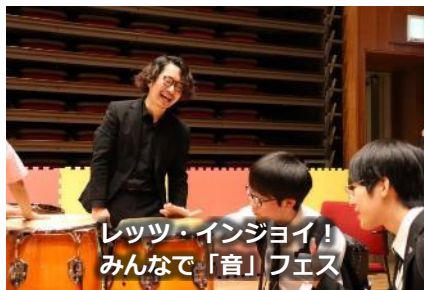
レッツ・インジョイ！ みんなで「音」フェス