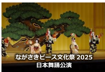
ながさきピース文化祭 2025 日本舞踊公演