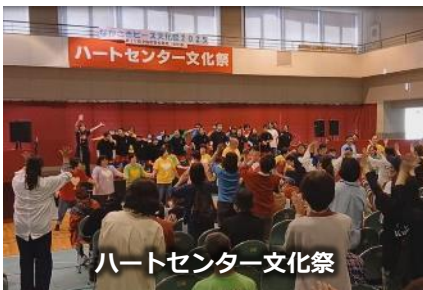
ハートセンター文化祭