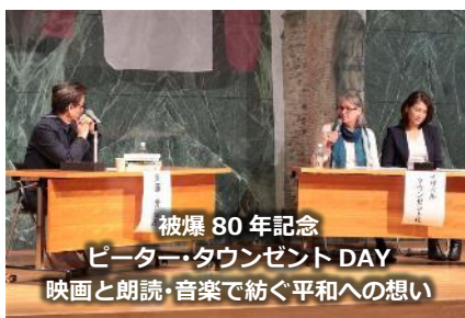
被爆 80 年記念 ピーター・タウンゼント DAY 映画と朗読・音楽で紡ぐ平和への想い