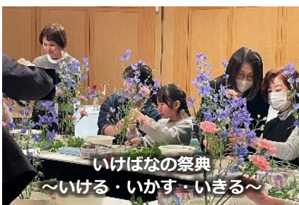
いけばなの祭典 ～いける・いかす・いきる～