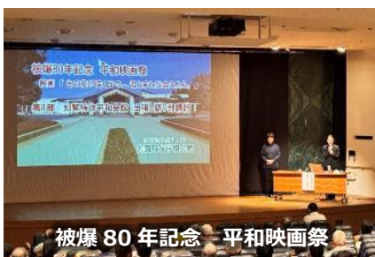
被爆 80 年記念 平和映画祭