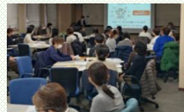
在宅看看連携事例検討会