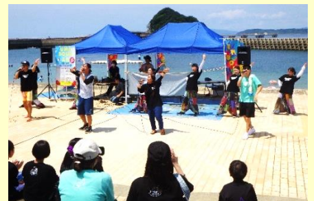
昨年のUMIBOUZ IN 高島の様子