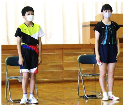
7月15日（水）には、「励ます会」も行われました。