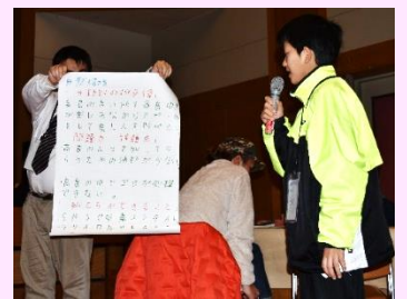
第2回高島ワイワイ話そう会の様子

※ 参加者同士が一定の距離をとるよう配慮するなど、コロナ対策をとった上で開催します。マスク着用をお忘れなく。