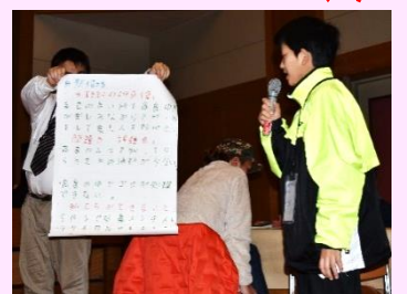
第2回高島ワイワイ話そう会の様子

※ 参加希望のかたは、地域センターだより8月号の折込チラシ裏面に記入の上、高島地域センターへお申し込みください。