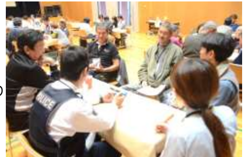
第1回高島ワイワイ話そう会の様子(11月9日(土))

事前の申し込みは不要です。高島町にお住まいのかたや関わりのあるかたなら、どなたでも参加できます。 詳しくは、今月号の折込チラシをご覧ください。