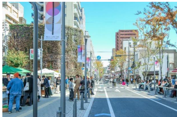
歩道空間を活用した賑わい創出