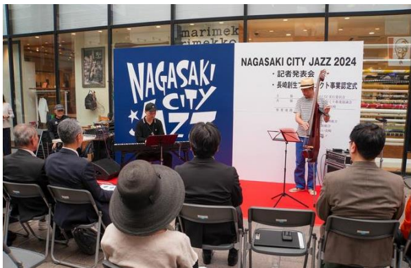
ジャズを通じた長崎のまちのブランディング

都市空間を使いこなし「空間」を「居場所」に変えていくため、様々な関係者と連携・協働する体制や仕組みづくり