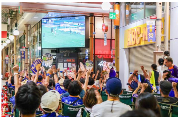
スポーツによる賑わい創出