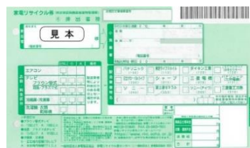
家電リサイクル券（見本）