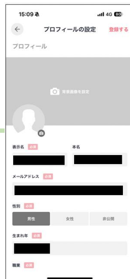
アクトコイン登録画面（見本）