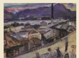
オランダ坂(油彩, 1954年)

独立美術協会所属。滞欧作品展が評価され第5回毎日芸術賞を受賞、「那智の滝」が第23回芸術選奨文部大臣賞を受賞。