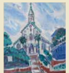
大浦天主堂(油彩, 1970年)