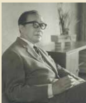
野口彌太郎 (1899~1976) NOGUCHI Yataro

日本的なフォービズムの画風を確立した画家。海外での制作活動を行いながら、戦後の長崎を幾度も訪れ、長崎の風景や人物を描いた。