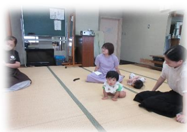
＜おはなし会の様子＞