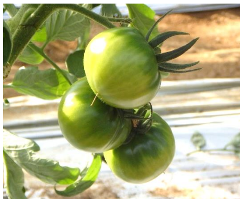
トマトはここまで大きくなっています。 (これからまだ大きくなり、赤く色づきます。)

高島トマトを栽培しているビニールハウス内の温度は、夜間は暖房で10℃前後に保たれていますが、日中は日光が当たるため25℃程度になるそうです。寒暖の差が大きいのはトマトの生育にとって好ましいのですが、急激な温度変化はかえってよくないため、日中はビニールハウスの天窓から外気を取り入れたりして、温度変化が緩やかになるようにしているとのことでした。