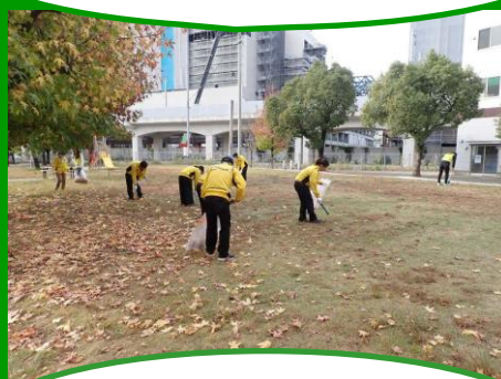
歩道のごみ拾いをしている ビッグ・ワン皆援隊さん