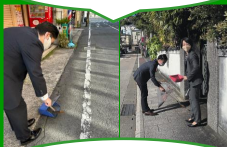
歩道の落ち葉を清掃している 株式会社 田浦組さん