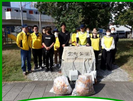
公園の清掃をしている 株式会社 星野組さん