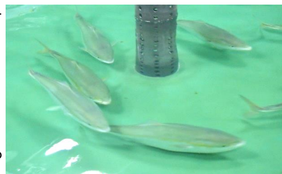
来年4～5月に産卵を控えた3歳のブリたち

今回も、ながさきBLUEエコノミー副プロジェクトリーダーである長崎大学の有瀧教授に、高島水産研究所のブリや、ながさきBLUEエコノミーのお話をうかがいました。