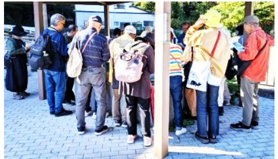
北溪井坑の模型を見ながら、ガイドの説明に熱心に耳を傾けている皆さん

今後も、こうした学びと交流の場を大切に育てながら、高島のファンを少しずつ増やしていけるよう、活動を続けていきたいと思います。