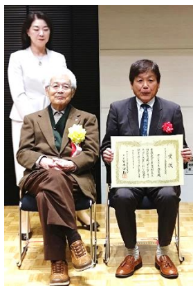
主催者の代表である養老孟司氏(左前列)