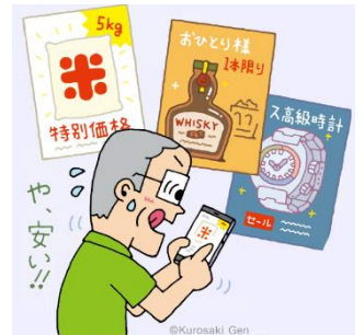
本文イラスト 黒崎 玄

（見守り新鮮情報 第515号（2025年7月3日）発行：独立行政法人国民生活センター）