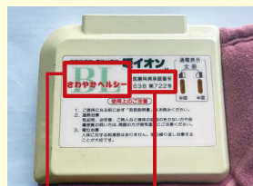
製品名 医療用具承認番号