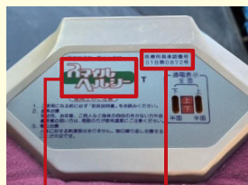
製品名 医療用具承認番号