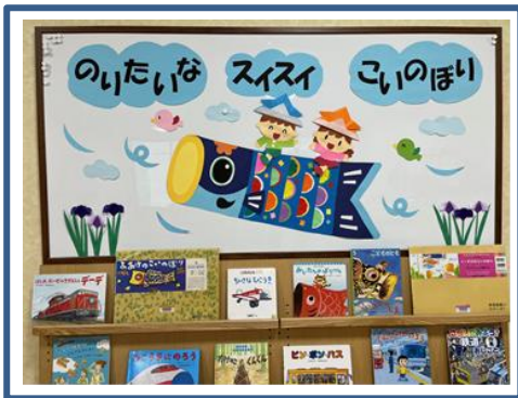
「児童コーナー」の掲示板