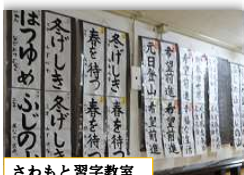
さわもと習字教室