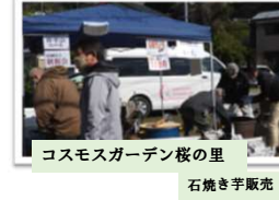
コスモスガーデン桜の里 石焼き芋販売