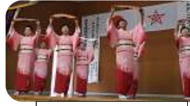
三重ニュータウンしらさぎ会