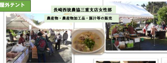
長崎西彼農協三重支店女性部 農産物・農産物加工品・豚汁等の販売