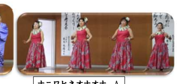
ナニワヒネオナオナ A