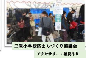
三重小学校区まちづくり協議会 アクセサリー・雑貨作り

「いつでも、だれでも、集い学びあい ひと声かけて、みんなで参加 よかまちづくり」 広げよう地域の輪