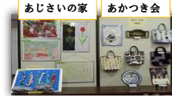
あじさいの家 あかつき会