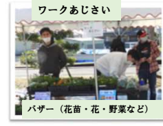
ワークあじさい パザー(花苗・花・野菜など)