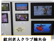
歌川老人クラブ楠木会