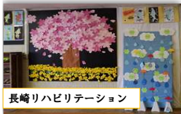
長崎りハビリテーション