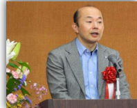
長崎市長 鈴木 史朗 様