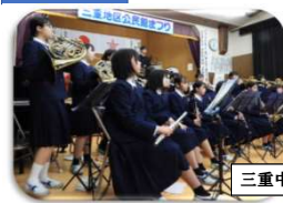
三重中学校吹奏楽部