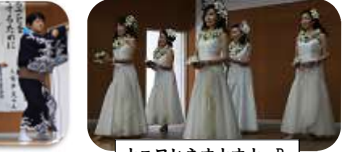
ナニワヒネオナオナ B