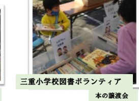
三重小学校図書ボランティア 本の譲渡会