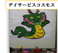
デイサービスコスモス