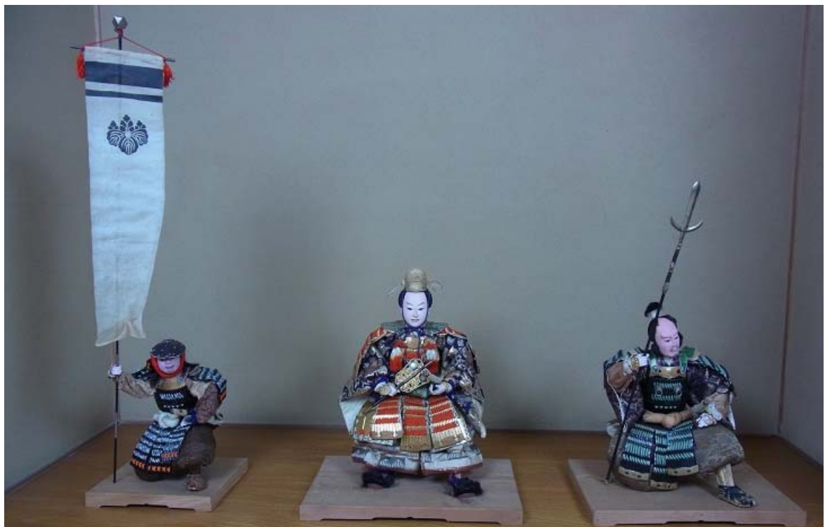
端午の節句人形(雑兵・豊臣秀吉・加藤清正) 明治34(1901)年 長崎市小川町 西家旧蔵品