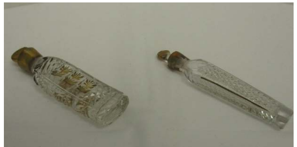
村上家資料(金彩カットガラス香水瓶) 19世紀前期