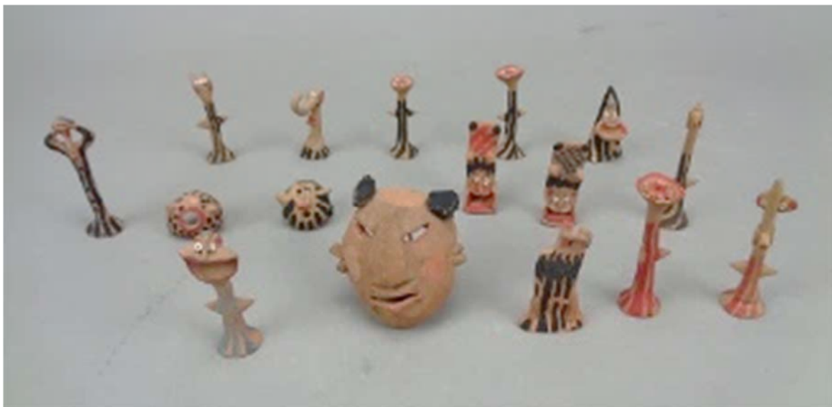
とんちんかん人形(久保田 馨作)