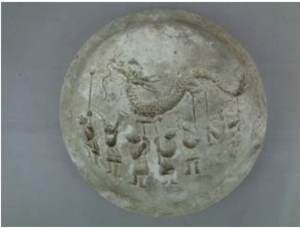
愛宕焼鑄型(中原仁市氏作) 昭和時代 中山雪子氏寄贈