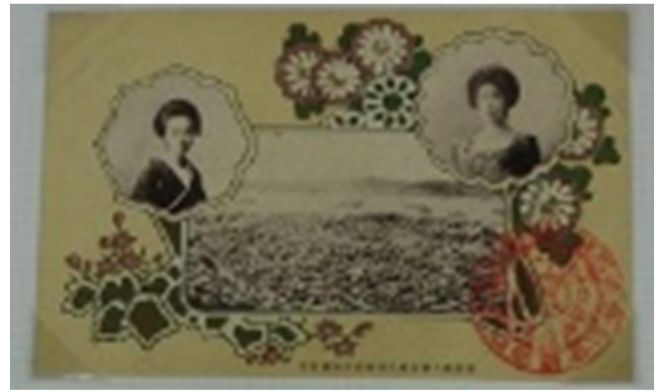
葉書(市内中心市街地) 明治40(1907)年頃 陣野 みどり氏寄贈