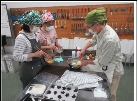
『家庭でできるおいしいパンづくり』