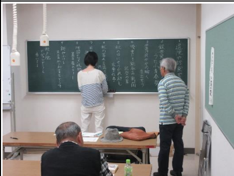
続・俳句を続けよう ～五七五に慣れてきた?～