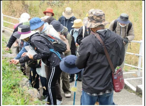
『里山散策』 ～秋の植物を楽しもう～