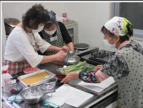
『バラエティクッキング』