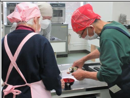
『食改さんの男性のための介護食教室』