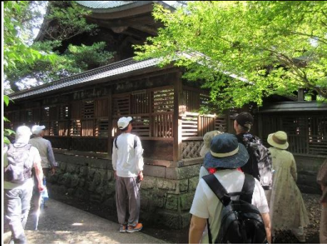
『長崎の風景を歩く』