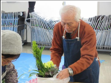
『山野草の寄せ植え・ Xmas リース』