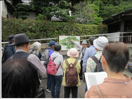
『絵図でさるく長崎学』