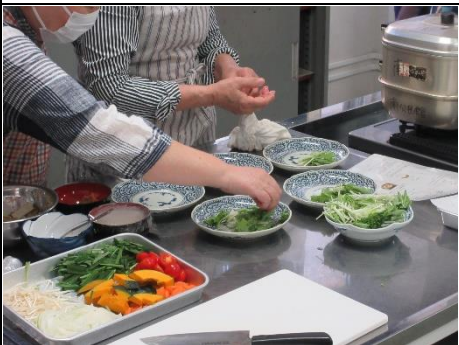
『食改さんのバランスの良い減塩食教室』