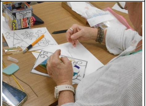
『素敵なグラスアート』