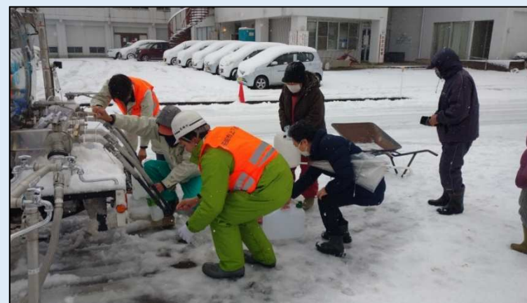
【能登町での拠点給水作業の様子】