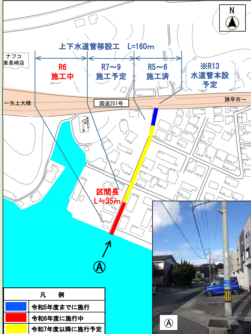
平面図（上下水道管移設：R5～R9）