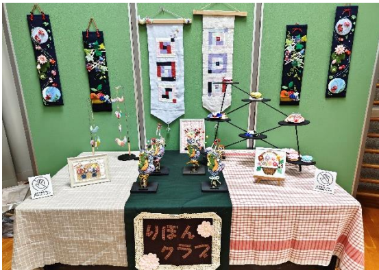
学習グループ「りぼんクラブ」