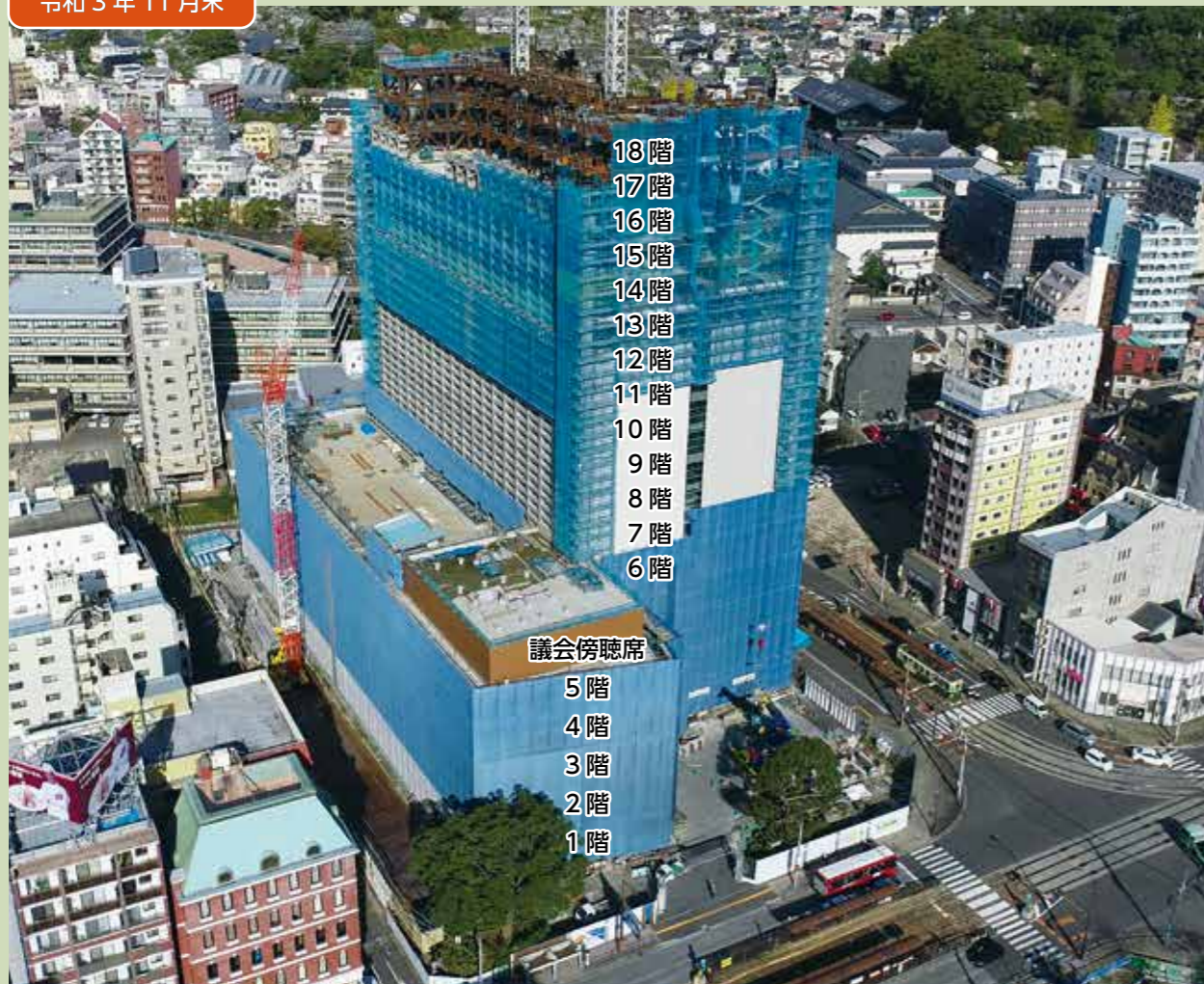
16階部分の柱や梁などの工事を進めています