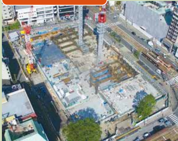
地下躯体工事が終盤を迎え、地上部分の躯体工事を始めています