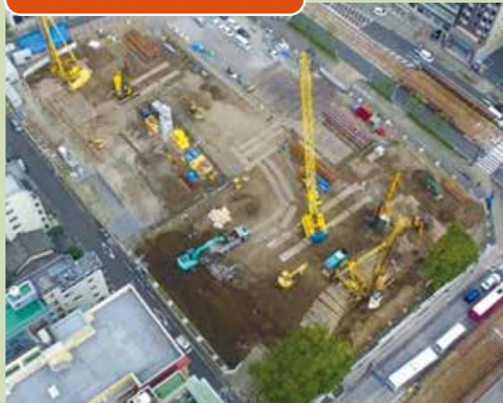
地下を掘ったときに周囲の土が流れ込まないように山留工事をしています