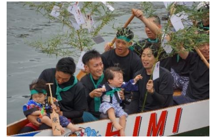
(昨年の初節句パレード)