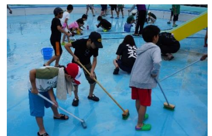
(6月15日のプール清掃)