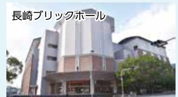
長崎ブリックホール ベネックス長崎ブリックホール (株式会社日本ベネックス)