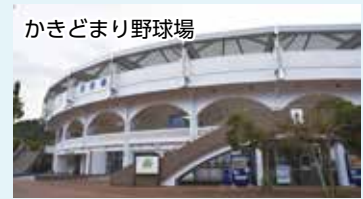
かきどまり野球場 SUNボールパークかきどまり (株式会社SUNホールディングス)