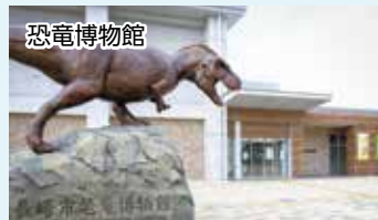
恐竜博物館 ベネックス恐竜博物館 (株式会社日本ベネックス)

(3月末まで:資産経営室 ☎829-1412 4月から:資産経営課 ☎829-1127)