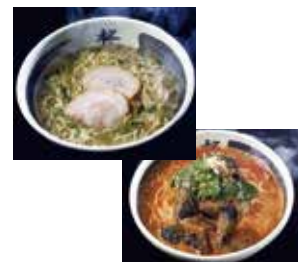
麺とスープのみのセット(具材なし)です

創業当時から根強い人気で店主こだわりの あおさらーめんと、老若男女問わず人 気のトマトらーめん各2食の食べ比べ セットです。一度食べたらやみつきにな ると噂のラーメンをお楽しみください。