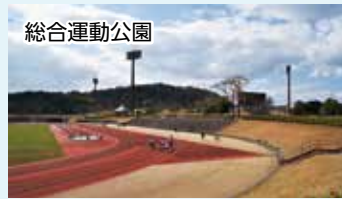
総合運動公園 ベネックス総合運動公園 (株式会社日本ベネックス)