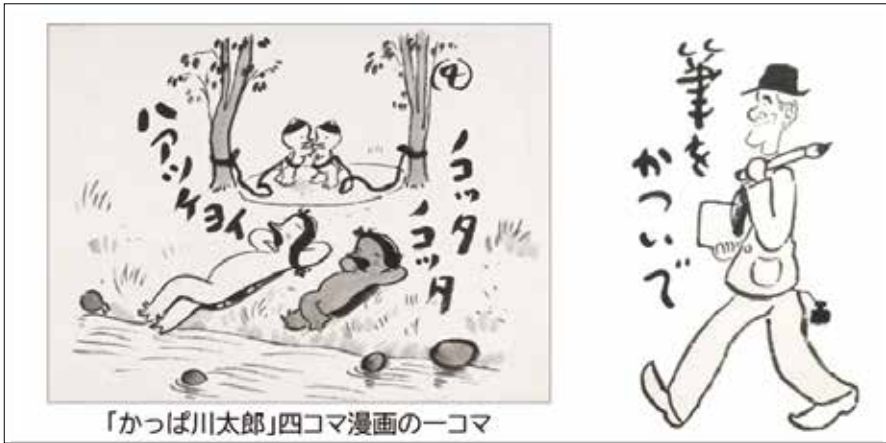
「かっぱ川太郎」四コマ漫画の一コマ