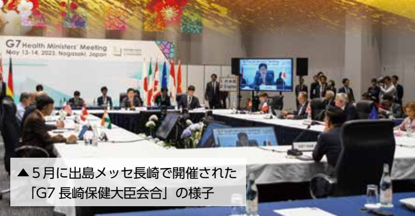
▲ 5月に出島メッセ長崎で開催された「G7 長崎保健大臣会合」の様子