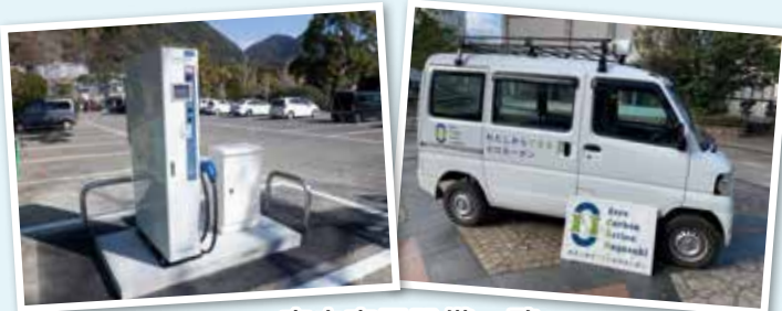
市内充電設備一覧

市では、ゼロカーボンシティ実現のため、現在、公用電気自動車を17台所有しています。また、充電設備を市内各地に設置していますので、ぜひご利用ください。(ゼロカーボンシティ推進室 ☎829-1251)