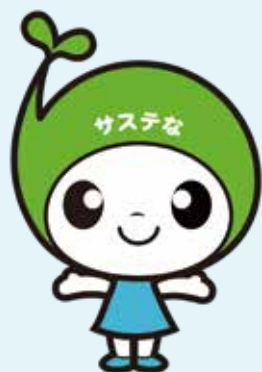
サステなっちゃん