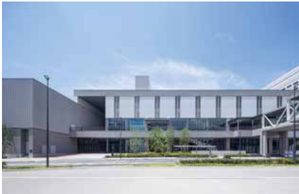
長崎駅いなさ口のすぐ側に位置する出島メッセ長崎。