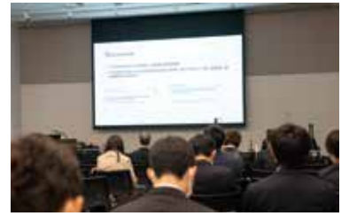
イベント・展示ホール(左)やコンベンションホール(右)には、多くのかたが訪れます。