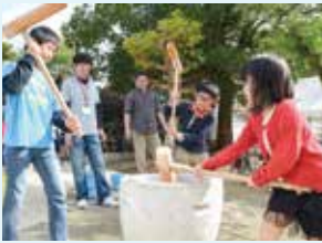
地域のイベントへの参加