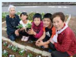
花を植えてまちに彩りを